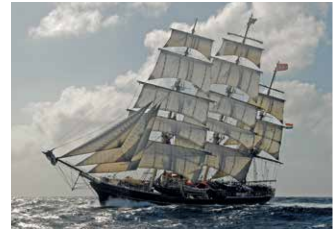
Stad Amsterdam Length 78 m Passengers 18/daytrips 125