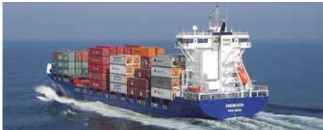
Energizer Length 134.65 m Capacity 750 TEU