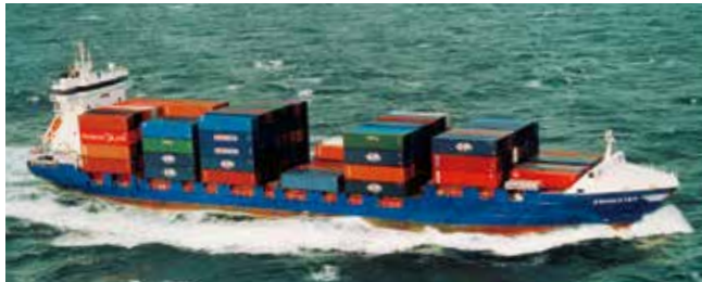
Encounter Length 134.65 m Capacity 750 TEU