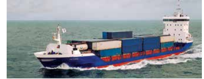
Bermuda Islander Length 99.98 m Capacity 430 TEU