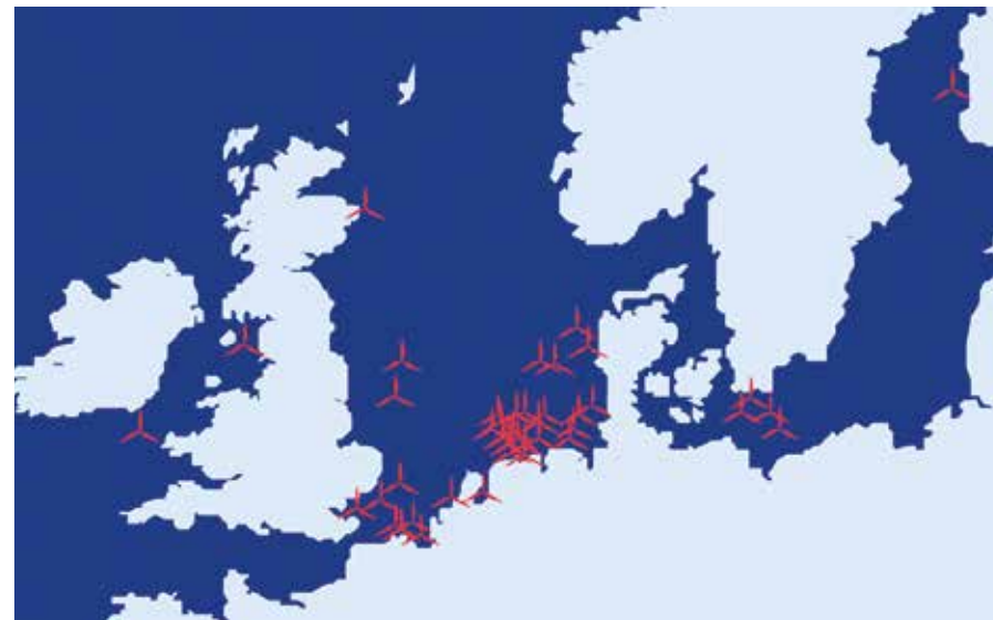
Activiteiten SeaZip op de Noordzee, in de Ierse Zee en in de Botnische Golf.

De tweede helft van 2020 was turbulent voor SeaZip Offshore Service, actief met vier crew transfer vessels en één survey schip. Om binnen lopende projecten adequate capaciteitsoplossingen te bieden, wist SeaZip binnen collegiale samenwerkingsverbanden geregeld extra schepen in te zetten. SeaZip was in 2020 bij vrijwel alle relevante offshore windenergieprojecten op de Noordzee betrokken. Hoewel SeaZip Offshore Service in 2020 ondersteuning bood bij O&M-werkzaamheden aan olie- en gasplatforms, lag en ligt de nadruk op offshore windenergie. Het is een markt waarvan de dynamiek grillig is, maar de groei zet door en manifesteert zich vooral in de ontwikkeling en realisatie van grootschalige parken met zeer robuuste en geavanceerde windturbines.