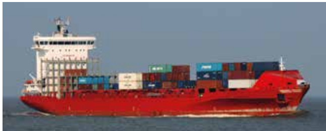
Esperance Length 168.10 m Capacity 1436 TEU