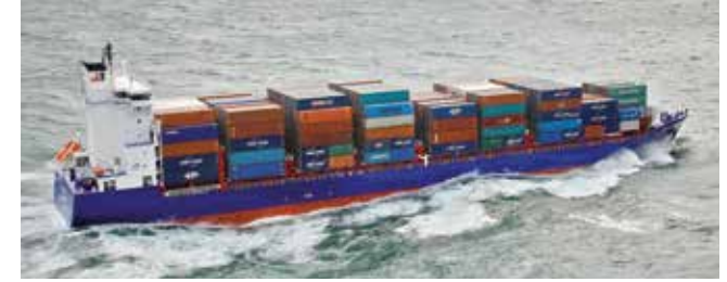
Emotion Length 170.15 m Capacity 1440 TEU