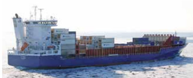
Elysee Length 167.00 m Capacity 1400 TEU