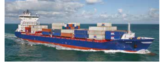
Empire Length 170.15 m Capacity 1440 TEU