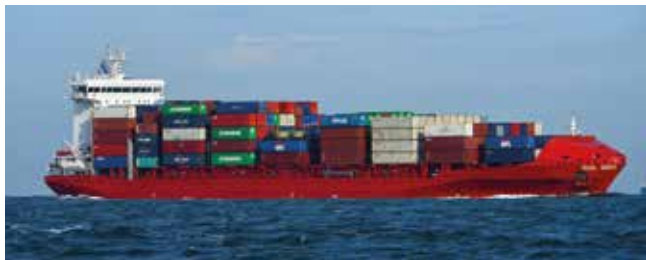
Espoir Length 168.10 m Capacity 1436 TEU