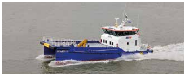
SeaZip 6 Length 26.30 m Passengers 12 Speed 25 kn