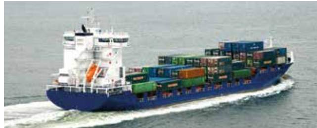
Energy Length 134.65 m Capacity 750 TEU