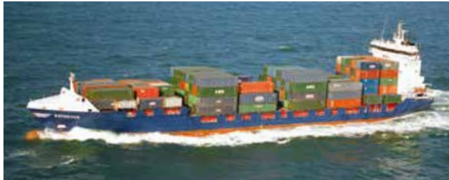
Enforcer Length 134.65 m Capacity 750 TEU