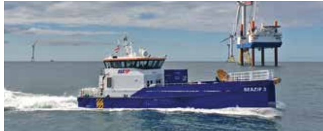
SeaZip 3 Length 26.30 m Passengers 12 Speed 25 kn