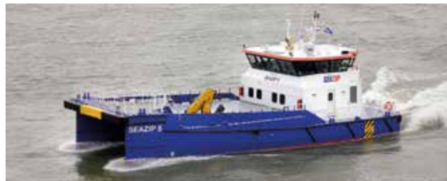
SeaZip 5 Length 26.30 m Passengers 12 Speed 25 kn