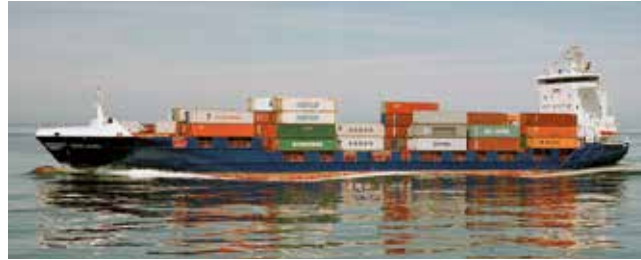
Endurance Length 134.65 m Capacity 750 TEU