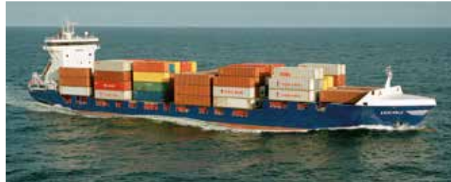
Ensemble Length 134.65 m Capacity 750 TEU