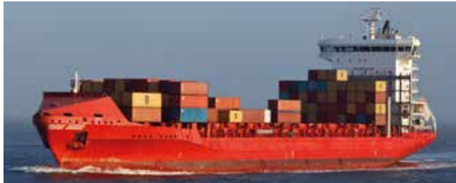
Escape Length 168.10 m Capacity 1436 TEU