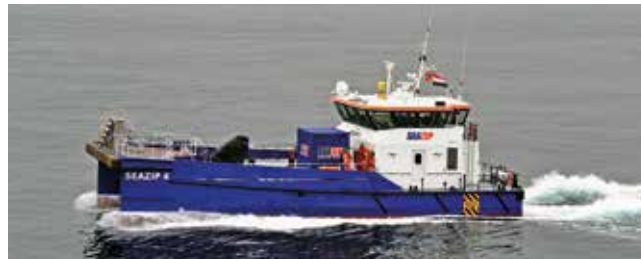
SeaZip 4 Length 26.30 m Passengers 12 Speed 25 kn