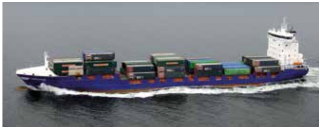
Endeavor Length 134.65 m Capacity 750 TEU