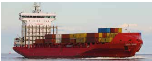
Essence Length 168.10 m Capacity 1436 TEU